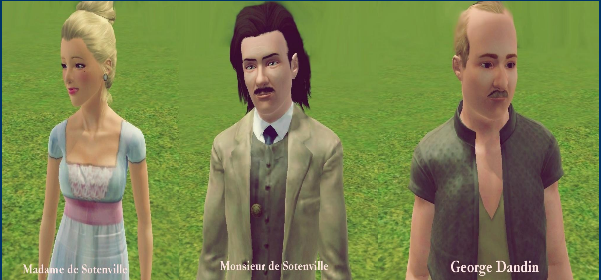
Madame de Sotenville