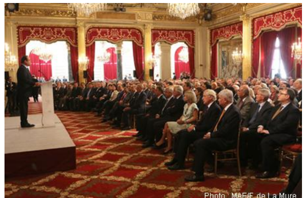
Discours du Président de la République, François Hollande, lors de la XXème Conférence des Ambassadeurs