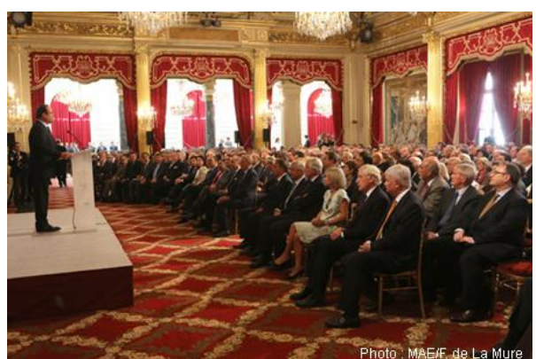
Discours du Président de la République, François Hollande, lors de la XXème Conférence des Ambassadeurs