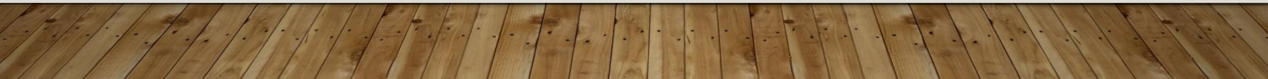
TABLEAU DE PRESENCE DES PERSONNAGES