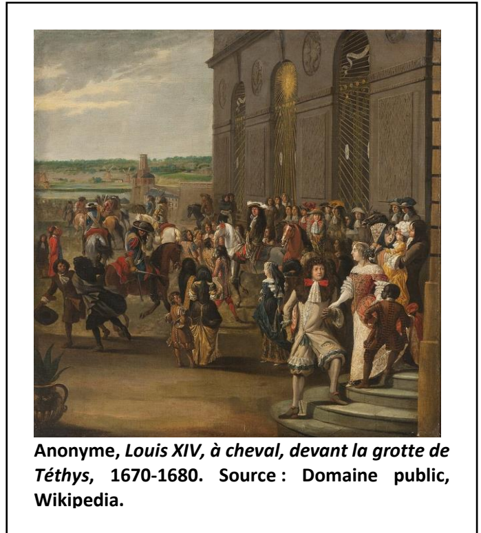
Anonyme, Louis XIV, à cheval, devant la grotte de Téthys, 1670-1680.

Dans le roman de Mme de La Fayette, l'interdiction vaut pour les moindres démarches, les moindres objets. Tout ce que touche Mme de Clèves doit sortir nécessairement de l'ordinaire. jusqu'à « la canne des Indes ».